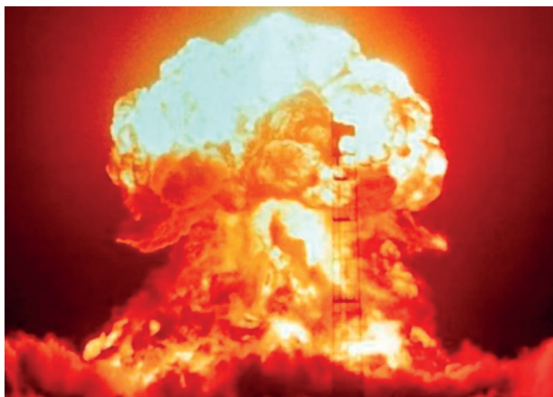
Figura 3, Prueba nuclear en el Desierto de Nevada de 1953